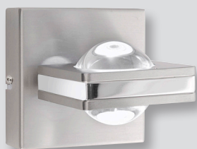
z.B. Art.-Nr. 9115-55